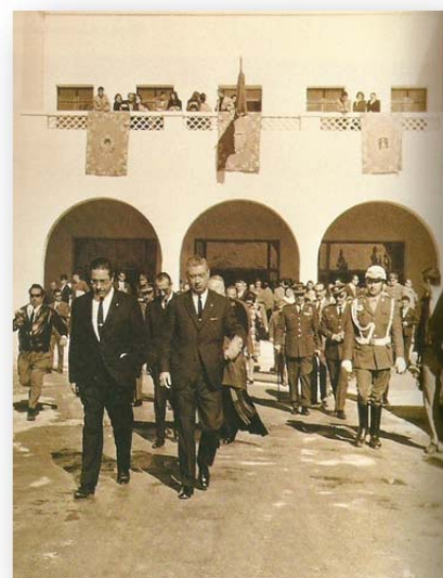
Inauguración oficial del CEU Alicante