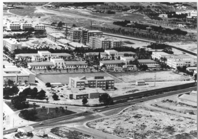
Vista del CEU de Alicante

Si bien la tradición universitaria de los estudios humanísticos en Alicante se remonta al histórico centro de Santo Domingo de Orihuela , (1610-1808), la actual Facultad de Filosofía y Letras tuvo su origen en el Centro de Estudios Universitarios, que sería el embrión de la futura Universidad de Alicante. En 1963 se constituyó el Patronato Alicantino de Estudios Superiores (PAES), que se encargará de canalizar las inquietudes y las acciones a favor de la institucionalización de los estudios universitarios en la provincia.