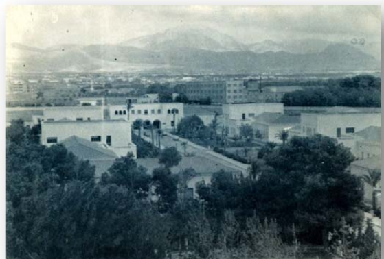
Vista del CEU de Alicante.

El 21 de octubre de 1968 una Orden Ministerial reconocía al CEU de Alicante como “Centro Universitario adscrito a la Universidad de Valencia al conjunto orgánico comprensivo de los de este nivel y contenido dependientes del Patronato Alicantino de Enseñanza Superior”. Para instalar las nuevas instalaciones universitarias se optó por una ubicación periférica con la previsión de su futuro desarrollo y ampliación en un concepto arquitectónico de campus compacto. La cesión de un sector del antiguo aeródromo de Rabasa, perteneciente al Patrimonio del Estado y adscrito al Ministerio del Aire, permitió aprovechar los pabellones preexistentes en los que se introdujeron las reformas, estrictamente necesarias, para adaptarlos a su nueva finalidad educativa y universitaria