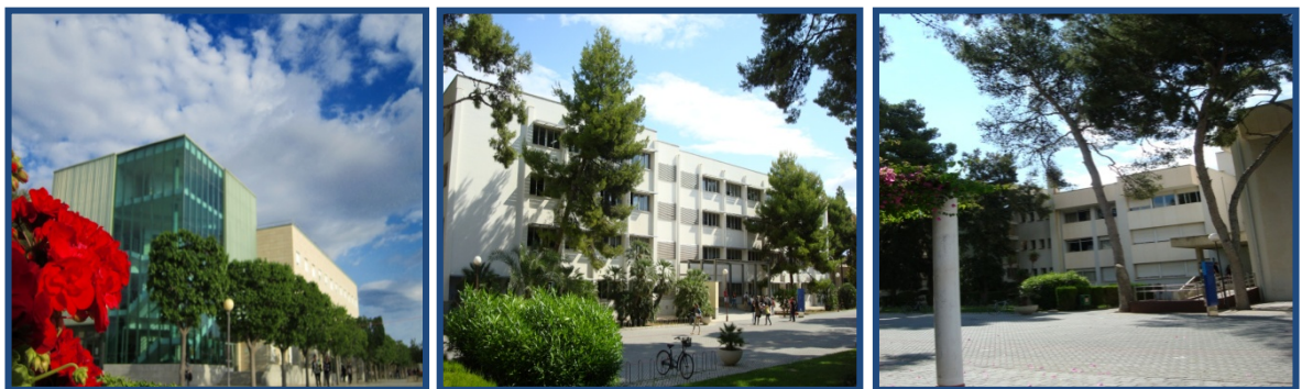
Edificios de Filosofía y Letras