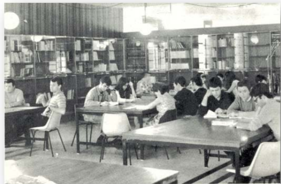
Seminario de Lengua y Literatura División de Filosofía y Letras

En su primer año la División de Letras contó con 124 alumnos, incrementándose notablemente el curso 1969-70 hasta llegar a la cifra de 300, una tendencia de crecimiento que se consolidaría en los años siguientes. En la Memoria del CEU correspondiente al curso 1971-72 se reflejaba en uno de sus párrafos la sociología, procedencia y situación socio-económica de su alumnado, haciéndose constar que en su mayoría procedían “de las clases media y modesta constituyendo este Centro la única posibilidad de acceso a los estudios universitarios”, procediendo más de un tercio de los matriculados de distintas localidades de la provincia