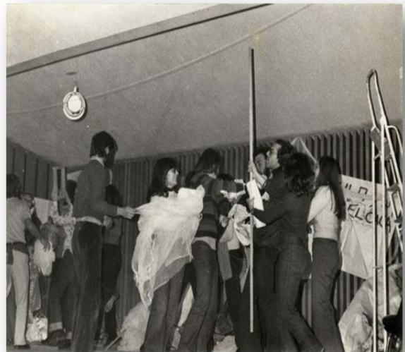
Biblioteca y grupo de teatro del CEU

En marzo de 1975 se publicaba el decreto de adaptación por el que el CEU pasaba a ser el Colegio Universitario de Alicante (CUA), aunque mantenía el nombre de “Centro de Estudios