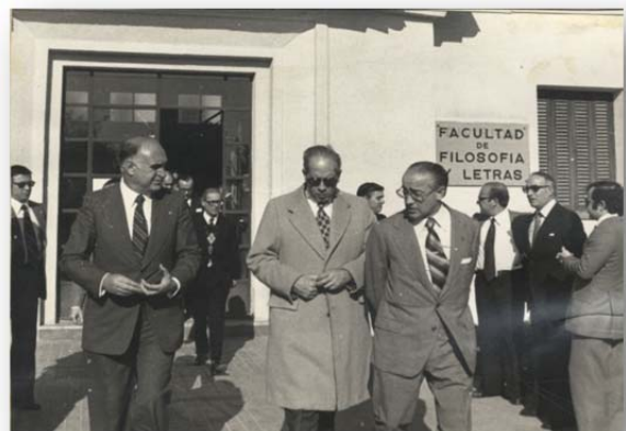
Facultad de Filosofía y Letras 1975

Tres años más tarde con la Ley 29/1979, de 30 de octubre, que creaba la Universidad de